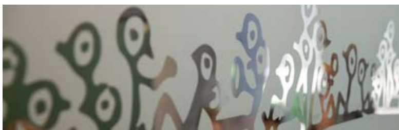
9 y 10 Los vinilos de colores sirven para dotar de calidez a los espacios y, al mismo tiempo, como señalizadores.