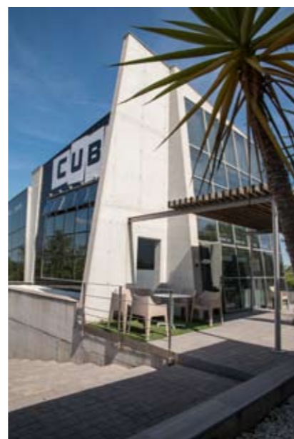
El edificio del que partía el centro obtuvo un premio de Arquitectura en su momento.

EB Inmuebles realizó la obra de adecuación de un edificio para convertirlo en el centro de idiomas Cube, proyectando su imagen corporativa, el amueblamiento, la iluminación y la decoración del interior de este edificio para su dedicación a la formación de idiomas.